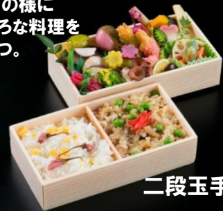
二段玉手箱弁当 2,160円