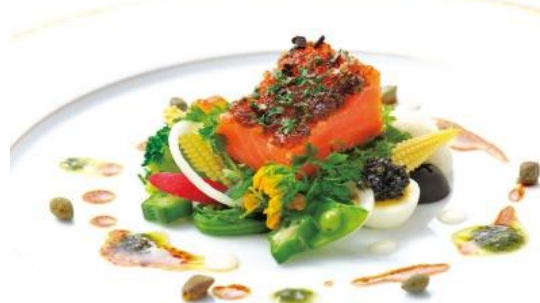
プチ洋食ランチ 3,300円