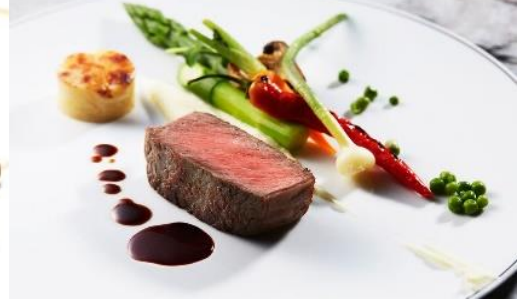
贅沢和洋ランチ 4,400円