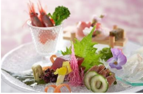
ミニ会席ランチ 3,300円